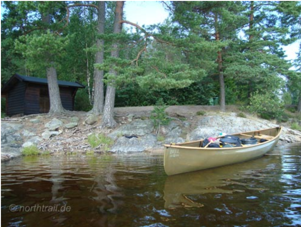
Dieser Windschutz am Mellan Kornsjön gehört zum Wanderweg „Bohusleden“.

Mit einer Länge von ca. 7 km ist der Mellan Kornsjön der kleinste der drei Seen. Am nördlichen Westufer tangiert der Wanderweg „Bohusleden“ das Seeufer. Dort und auf der Insel „Stora Lövön“ in Seemitte befinden sich jeweils ein Windschutz mit Feuerstelle und Plumpsklo.