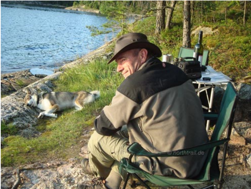
zufrieden, entspannt, glücklich

Das Donnern eines nahenden Gewitters und aufs Zelt prasselnde Regentropfen wecken uns am Morgen des 4. Paddeltages. So richtig wohl fühle ich mich nicht, wenn sich das Camp auf einer Insel befindet und das Wetter mit Gewitter oder starkem Wind und hohen Wellen aufwartet. So schön auch das Insel-Feeling sein mag, so ein bisschen ist es dann wie „darauf eingesperrt“ zu sein bzw. bei einem „Ausbruch“ lauern Gefahren. Das Gewitter kommt jedoch etwas halbherzig daher und bald scheint wieder die Sonne. Dennoch hat es aufgefrischt und Wolkenbild sowie Windrichtung haben sich verändert. Ein Wetterwechsel steht vermutlich an. Um die Tour abzurunden, wollen wir aber auch noch bis zum Södra Kornsjön vorstoßen. Dazu brechen wir unser Lager ab. Paddeln mit dem beladenen Kanu erst mal zurück zum Kornsjö-Kiosk, um von dort mit dem Auto zum südlichen See umzusetzen. Ein etwa 3 km langer Kleinfluss, der auf dem mir vorliegenden Kartenmaterial namenlos ist, verbindet den Mellan und den Södra Kornsjön. Das Wasser fließt über einen Höhenunterschied von 5 m zwischen den Seen in Richtung Süden ab.