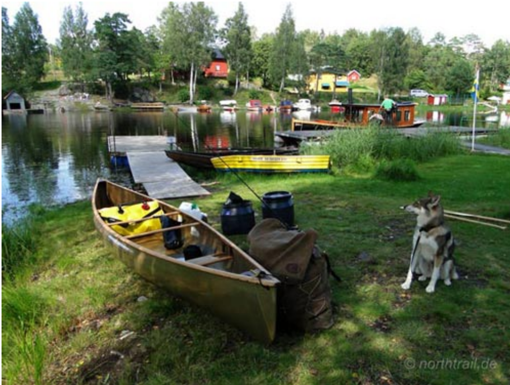
packen und beladen am Kornsjö-Kiosk

Nach dem immer wieder mühseligen und zeitraubenden Auseinandersetzen der Klamotten für die Tour, brechen wir an einem schönen Sommertag Anfang August zu unserem Kanuabenteuer auf.