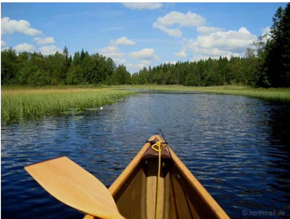
der Noraneälven verbindet den Norra mit dem Mellankornsjön