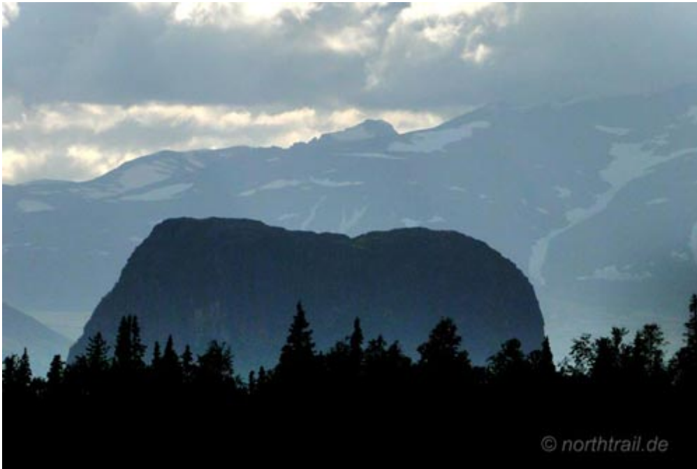
Nammatj ( Nammás ), der heilige Berg der Samis im Rappadalen/Sarek

Nach kurzer Aklimatisierungsphase am Polarkreis, bei doch recht schönem Wetter, ging es in Richtung Süden nach Dalarna, dem „Herz“ Schwedens. Im Grövelsjön Gebiet sollte unsere diesjährige Schweden-Paddeltour starten. Der Einfluss von THORAGALLES ist hier zwar nicht mehr so groß, dennoch möchte ich den Zustand des Wetters mit zwei Worten auf den Punkt bringen: „Regen, kalt“! Also für eine entspannte Urlaubs-Kanu-Tour nicht so nette Bedingungen. Die Mittelfristprognose stimmte uns ebenfalls nicht zu berechtigter Hoffnung. Was macht man da? Genau, das Beste draus! Das heißt, Nerven behalten und flexibel bleiben. Wir entschieden uns erstmal aus der derzeit ungastlichen Fjällregion weiter ins südlichere Värmland aufzubrechen. Diese Paddeltour lässt sich auch noch auf einer der kommenden Reisen nachholen.