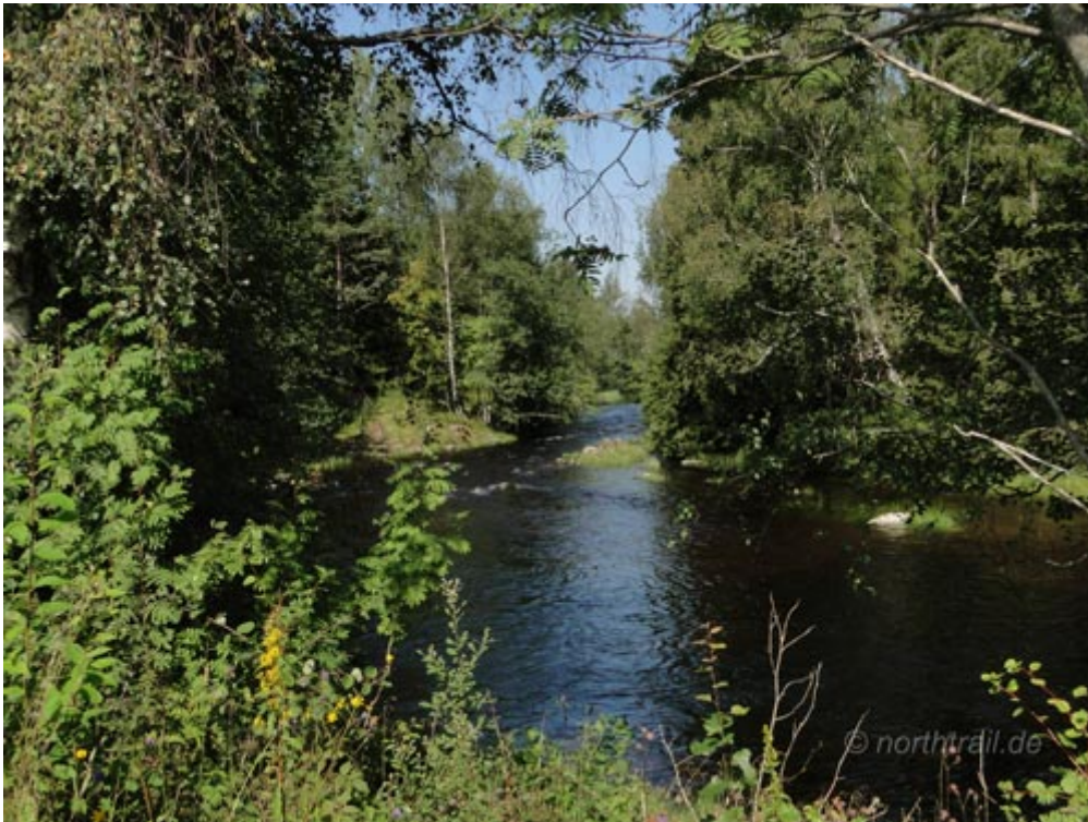
the „No name river“

Zunächst erkunden wir das Terrain und beschließen, dass ich den Fluss solo paddle. Karin fährt inzwischen mit dem Auto zur Brücke an der Straße 164 und wartet dort, um bei meiner Ankunft mit Dascha ins Kanu zu zusteigen. Ungefähr einen Kilometer hinterm Mellan Kornsjön kommt ein verblockter und bei Niedrigwasser nicht befahrbarer Flussabschnitt, der an einer Stau- bzw. Felsstufe endet. Spätestens hier muss umtragen werden. Die Portagestrecke, auf einer mit dem Bootswagen gut befahrbaren Schotterpiste, beträgt maximal 500 m.