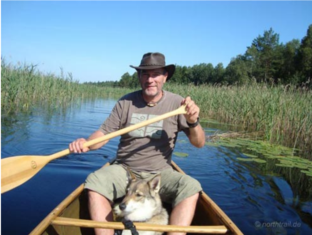
Suche nach der Zufahrt zum dem Noraneälven

Der etwa anderthalb Kilometer lange Noraneälven stellt die Verbindung zum Mellan Kornsjön dar. Versteckt im Schilfgürtel müssen wir das Flüsschen am Vormittag des dritten Paddeltages erstmal suchen. In der Vergangenheit wurde der Noraneälven immer mal wieder in mühseliger Handarbeit so vergrößert, dass er auch für etwas größere Wasserfahrzeuge schiffbar werden sollte. Aber gegenwärtig können die Seenverbindung allenfalls kleine Motorboote befahren. Große Motorboote oder gar Yachten sind auf den Kornseen ohne hin nicht anzutreffen.