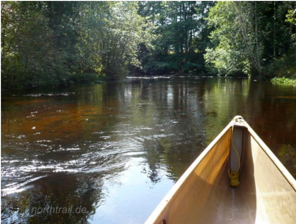
solo auf dem „No name river“

Danach geht es zunächst gut paddelbar weiter bis die Strömung 600 m vor einem Wehr fast zum Erliegen kommt. Eine Gasse ist für die 20 m lange Umtragung über einen Felsen für Paddler ausgewiesen. Die Straßenbrücke an der 164 eignet sich auch als Einstiegsstelle für diejenigen, die die Tour in Süd-Nord-Richtung paddeln wollen. Der Södra Kornsjön empfängt uns mit ordentlicher Welle, da der Wind genau in Seelängsrichtung von Süden her bläst. Erst einmal kommen zwei Abschnitte, die mit Buchten und Inseln nicht so zergliedert sind wie auf den beiden anderen beiden Seen. Laut Karte ändert sich das aber wieder im südlicheren Seeteil. Soweit kommen wir aber nicht, denn das windige Wetter zwingt uns zur Umkehr.