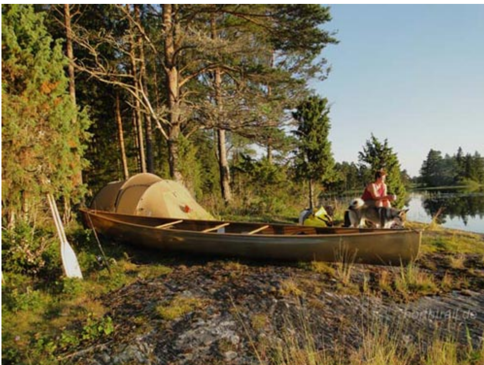
Camp am Norra Kornsjöm

Der Norra Kornsjön, auf dem wir die Tour mit der Suche nach einem schön gelegenen Platz für unser erstes Camp beginnen, ist durch einen ca. 1 km schmalen Abschnitt am norwegischen Örtchen Kornsjö so zerteilt, dass man diesen auch für zwei separate Seen halten könnte. Am äußersten nordöstlichen Ende finden wir auf einer kleinen Landzunge mit felsigem Ufer ein nettes Plätzchen. Bei Sonnenuntergang leuchtet der Rotwein in unseren Gläsern in einem besonders warmen Farbton.