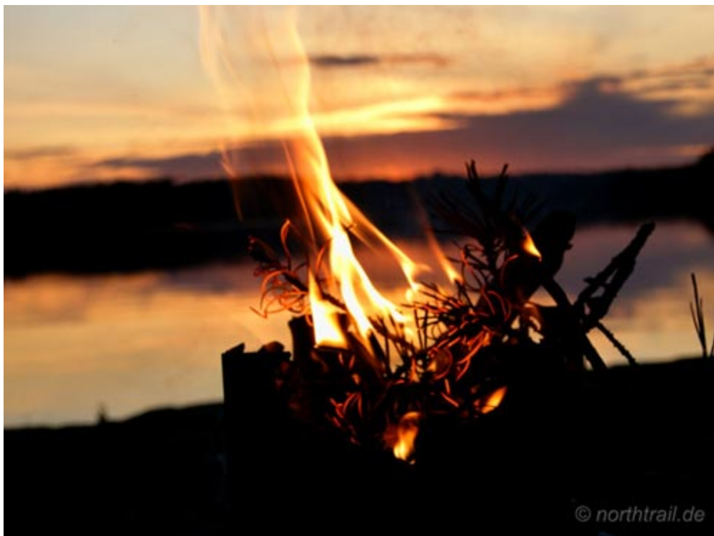
Künzi-Lagerfeueratmosphäre am Norra Kornsjön

Im Dialog zweier gereifter Philosophen über „Gott und die Welt“, der durch einen herrlichen Sonnenuntergang, Lagerfeuer im Künzi-Ofen und Rotweingenuss enorm beflügelt wird, lassen wir den Paddeltag ausklingen. Ach ja ...!