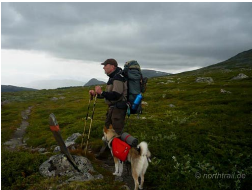
mit Rucksack, Zelt und Hund durchs lappländische Fjäll

Seit gut zweieinhalb Wochen sind wir im Norden unterwegs. Zunächst ging es rauf nach Schwedisch Lappland. Mit Rucksack und Zelt wanderten wir 6 Tage durchs Fjäll. Die vielen Auf- und Abstiege haben uns dabei wieder so richtig fit gemacht. Ganz zu schweigen von den vielen kleinen und großen Episoden, die wir auf dieser Tour erlebten. Das Wetter zeigte sich dabei jedoch eher von seiner launischen Seite. THORAGALLES , der samische Donnergott, sparte nicht mit Nassem von oben. Aber auch die 10 Stunden heftigsten Dauerregen auf 800 m im Sarek Nationalpark haben wir im Zelt gut gemeistert. Für kommende Touren hat uns das nur gestählt. Nach dem Motto „Was uns nicht umbringt ...“. Na, ihr wisst schon was ich meine.