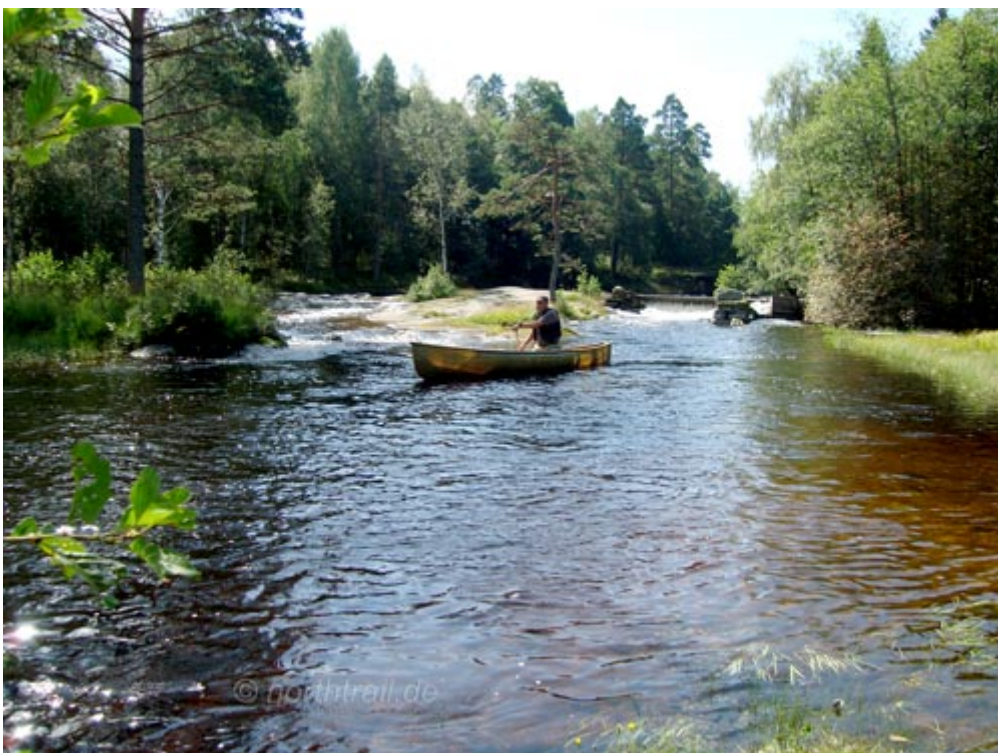
Einsetzstelle am Stau Richtung Södra Kornsjön

Zunächst erkunden wir das Terrain und beschließen, dass ich den Fluss solo paddle. Karin fährt inzwischen mit dem Auto zur Brücke an der Straße 164 und wartet dort, um bei meiner Ankunft mit Dascha ins Kanu zu zusteigen. Ungefähr einen Kilometer hinterm Mellan Kornsjön kommt ein verblockter und bei Niedrigwasser nicht befahrbarer Flussabschnitt, der an einer Stau- bzw. Felsstufe endet. Spätestens hier muss umtragen werden. Die Portagestrecke, auf einer mit dem Bootswagen gut befahrbaren Schotterpiste, beträgt maximal 500 m.