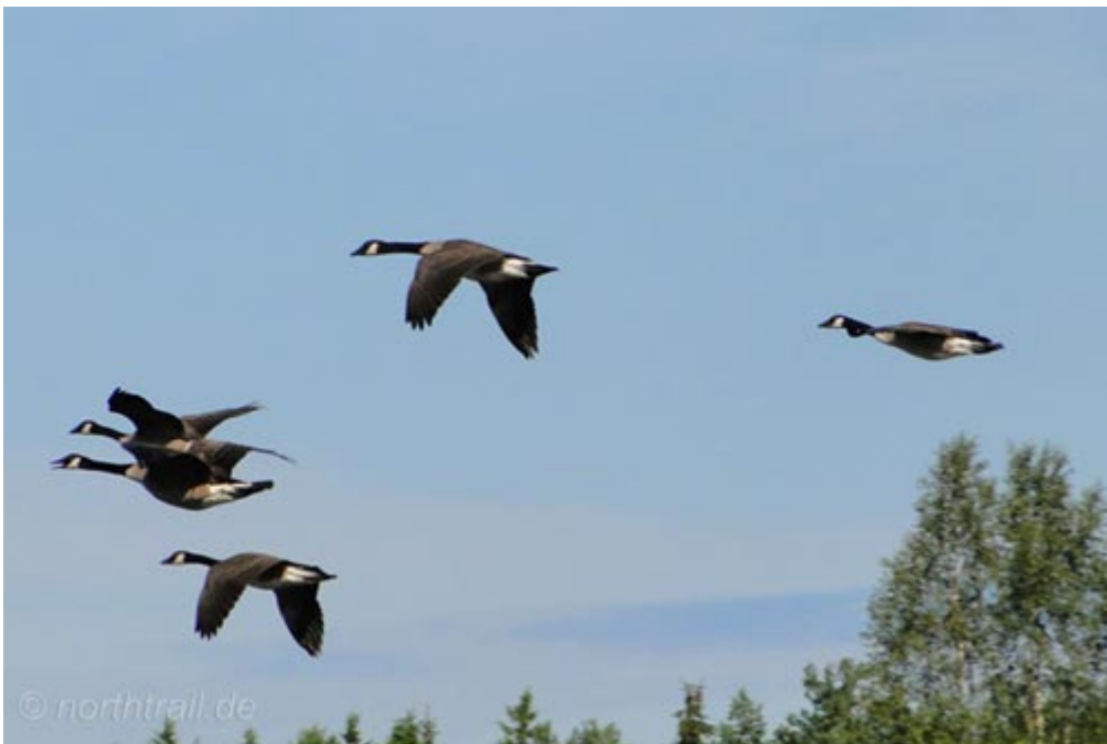
Kanadagänse drehen ihre Morgenrunde

Am Morgen begrüßen uns Kanadagänse mit ihrem lauthalsen Rufen, das Kilometer weit über die Seenlandschaft erklingt. Diese ursprünglich, wie der Name schon hinweist, aus Nordamerika stammende Gans wurde in den 1930er Jahren in Ostschweden ausgesetzt. Mittlerweile geht man von 10.000 Brutpaaren in Skandinavien aus. Bei den Kanadagänsen handelt es sich um sogenannte unproblematische Neozoen, dies sind etwa ab dem Jahre 1500 eingewanderte Tierarten, die keinen nennenswert negativen Einfluss im Ökosystem verursachen.