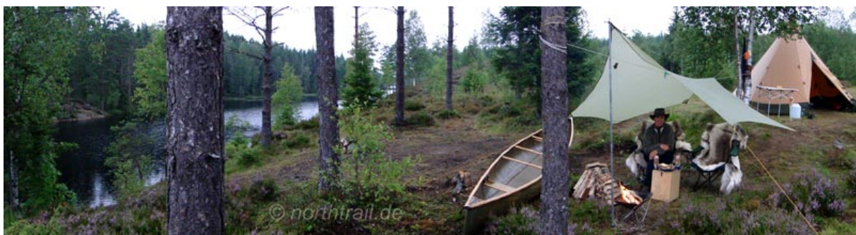
Camp im Glaskogen

Im Glaskogen Naturreservat angekommen, richteten wir uns erstmal ein Camp für einige Tage ein. Mit Pilze sammeln, angeln, Lagerfeuer, Kåta heizen und sonstiger Nordlandromantik verbrachten wir 4 schöne Tage.