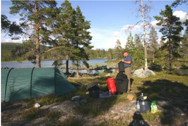
(Biwak am Nybodtjärnen)

In den Morgenstunden werde ich von dem penetranten nicht aufhören wollenden Rufen eines Vogels geweckt. Tschiii, Tschiii, Tschiii ....geht es laut und minutenlang. Das muss ein „Foltervogel“ sein.