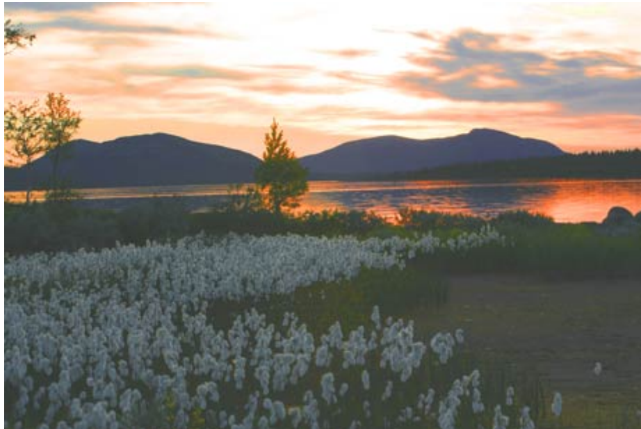
(Wollgras im Sonnenuntergang)

Das sind die Erlebnisse, die Nordlandfahrer süchtig werden lassen.