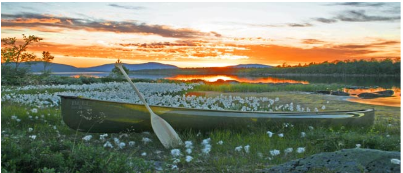
(am Ende des Paddeltages)

(Robert W. Service "Songs of a Sourdough" Toronto 1907)