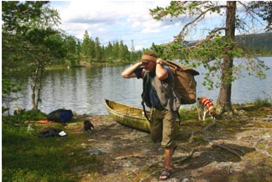
(auf einer von vielen Portagen)