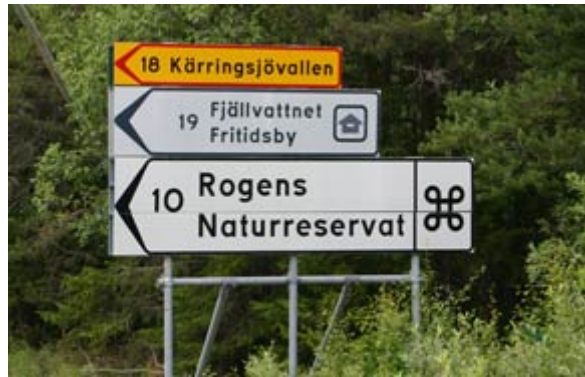
(Wegweiser an der Straße 311)

Am 20.07.06, gegen 17.00 Uhr kommen wir am Ende aller Wege in Käringsjön an. Erst mal atmen wir tief durch und sondieren das Umfeld. Um zu packen und los zu paddeln, fehlt uns an diesem Tag die Kraft. Eine gemütliche Blockhütte im Fjäll ohne Strom und Wasser ist für eine Nacht unser Quartier und bietet den Luxus nach vielen Nächten im Zelt wieder mal in einem Bett zu schlafen.