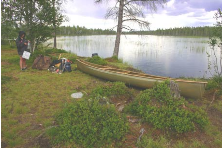
(vor der letzten Seeüberquerung am Käringsjön)