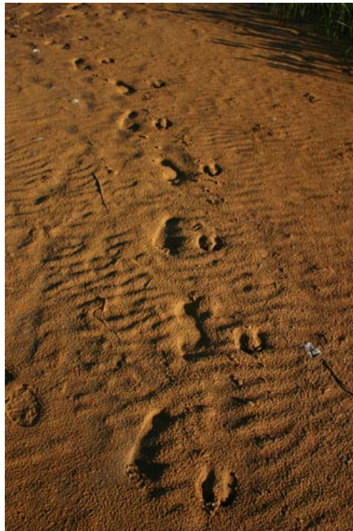
(Spuren am Strand)

Am Nachmittag sitze ich am Strand und schreibe Tagebuch. Der Himmel ist strahlend blau, ein leises Lüftchen weht und es ist warm, richtig warm. Wären da nicht die Rentierfährten im Sand, die Fjällgipfel am Horizont und würde die Sonne nicht um 20.00 Uhr noch hoch am Himmel stehen, könnte ich mich auch viele tausend Kilometer weiter im Süden befinden. Aber nein, ich sitze am Ufer des Rogen auf Position N 62°19'23,5" und EO 12°26'15,6", der gleichen nördlichen Breite wie Südgrönland.