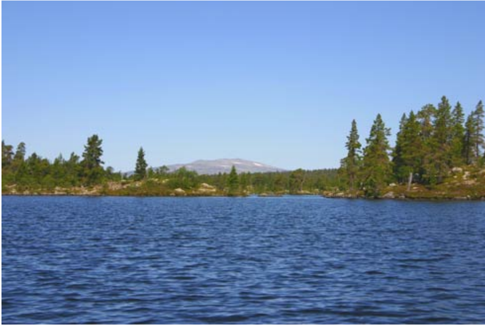
(Landschaft im Rogen Naturreservat)

Auf dem Krattelsjön ist die Paddelstrecke etwa doppelt so lang wie auf dem Hån. Es folgt wieder eine kurze Portage zum Uthussjön, der aus zahlreichen Buchten, Halbinseln und Inseln besteht. Danach folgt eine 50 m lange Portage in den „Namenlosen See“. Zumindest hat er auf der Karte keinen ausgewiesenen Namen. Es ist an der Zeit nach einem Biwakplatz für die Übernachtung zu suchen. Schön gelegene Stellplätze gibt es in diesem Seengewimmel ausgesprochen viele. Welcher ist aber der Schönste? Auf dem Nybodtjärnen, dem 6. See des Paddeltages, werden wir dann doch schnell fündig. Ein traumhafter Platz auf einer Halbinsel mit Südlage, 270° Seeblick und die restlichen 90° des Panoramas werden durch 1000 m hohe Fjällgipfel im Norden ausgefüllt. Nach dem das Camp eingerichtet ist genießen wir den lauen Abend, an dem die Sonne jetzt Mitte Juli erst um 22.30 Uhr untergehen wird. Diese absolute Stille zu erfahren, ist für mich immer wieder ein tolles Erlebnis. Ein Gefühl, als wenn die eigenen Gedanken hörbar werden. Und was soll man erst zum Wetter sagen. Einfach topp! Blauer Himmel, Sonnenschein und warm, teilweise zu warm. Nachmittags sind einige Quellwolken aufgezogen, die sich am Abend aber wieder aufgelöst haben. Das Barometer zeigt 934 hPa, Tendenz gleich bleibend, um 20.00 Uhr an. Da wir uns auf 780 m ü. NN befinden entspricht das einem Luftdruck von etwa 1014 hPa auf Meeresspiegelhöhe und dazu noch am Abend gemessen, das bedeutet Hochdruck.