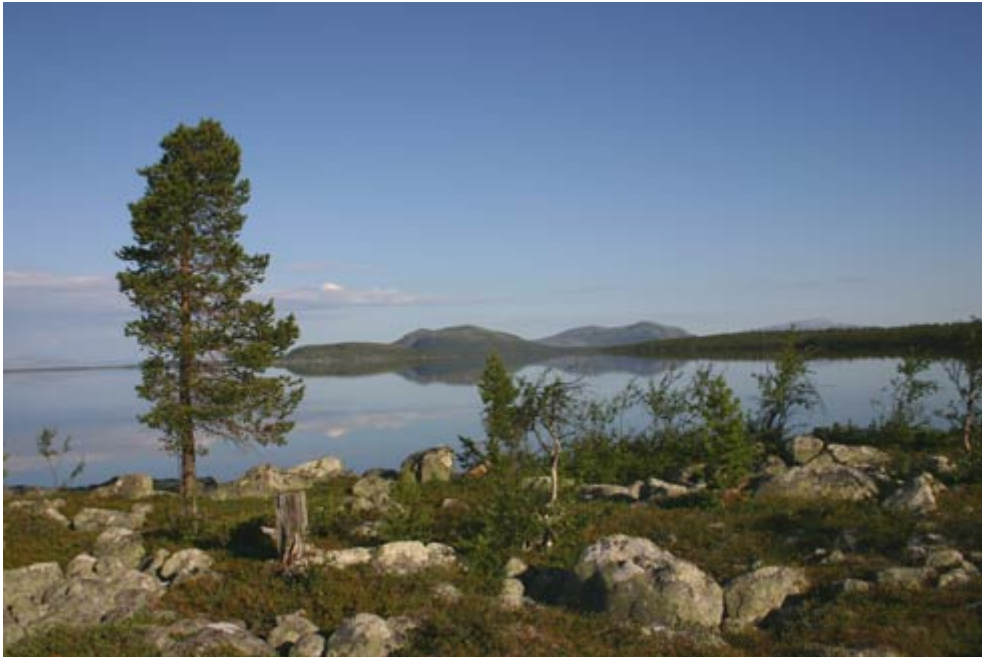
(Morgen am Rogen)

Sonnenuntergang wird heute um 22.27 Uhr sein. Um 20.00 Uhr steht die Sonne bei 280° und 15° hoch überm Horizont. Hier ein schattiges Plätzchen zu finden, ist bei den wenigen Bäumen gar nicht so leicht.