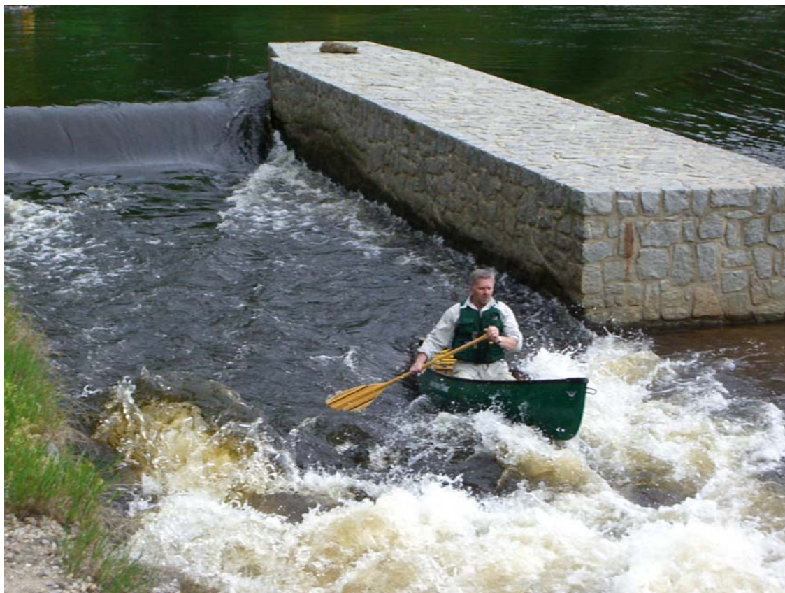
> Bezwingung des Wehres von Nové Spolí