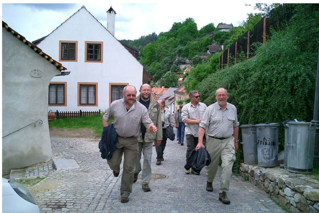
> Auf den Weg in die Altstadt von Český Krumlov

Wieder geht es über die alte Holzbrücke auf die andere Seite der Moldau und auf direktem Weg, d. h. hügelab und hügelab, Richtung Altstadt.