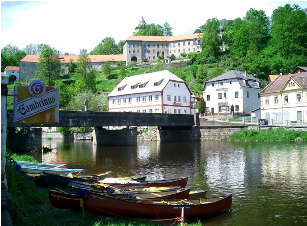
> Mittagsrast in Rožmberk