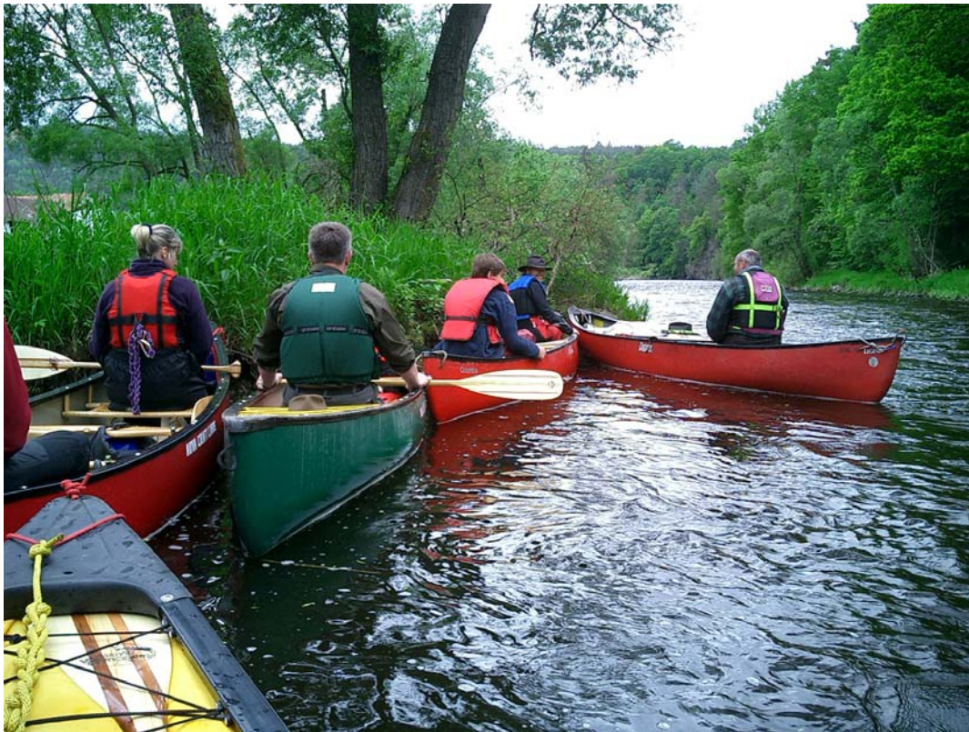
> Atempause zwischen den Schwallstrecken

Schließlich beruhigt sich die Moldau wieder und bewegt sich nur noch langsam auf das zerfallene Wehr „U Rybů“ zu. Aber wo ist der Absatz, der die in die Zunge einfahrenden Paddler kurzzeitig außer Sicht bringt? Wo sind die sich auftürmenden Wellen, die manches Boot in eine Badewanne verwandeln können? Nichts davon ist mehr da! Der derzeitige Wasserstand hat alles geschluckt bzw. geglättet, so dass nur ein Bruchteil des schönen Schwall übrig geblieben ist, der auf diese Art alle trocken durchs Wehr geleitet. Knapp 100m dahinter türmt sich die große Wehranlage „Zátkův mlýn – Březí“ vor uns auf, die links umtragen werden muß, da keine Bootsgasse zwischen den diversen schrägen und senkrechten Abfällen ins Unterwasser führt. Noch wenige Meter sind zu paddeln, und wir haben unsere Aussetzstelle in Boršov erreicht.