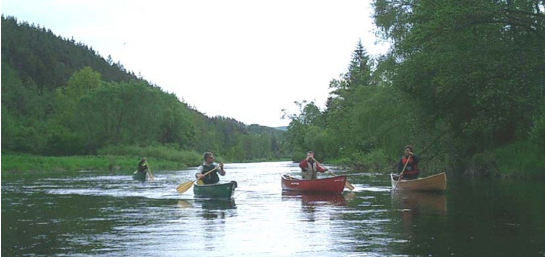
> Kurzer Plausch in einsamer Kulisse