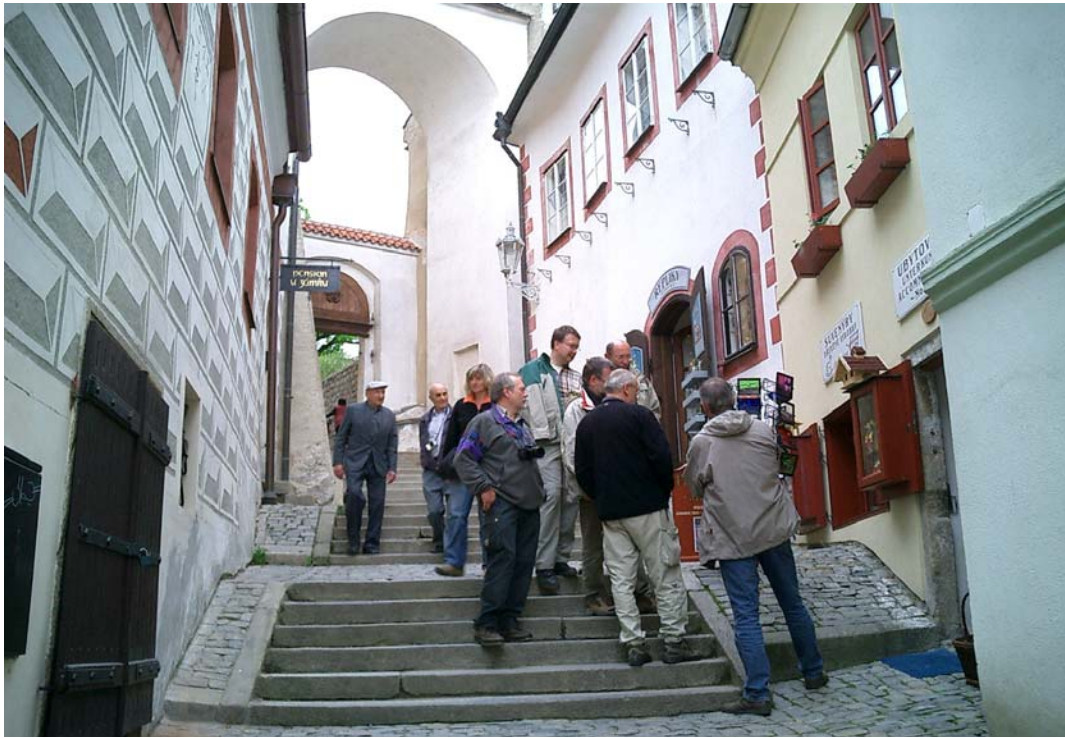
> In den Gassen von Český Krumlov