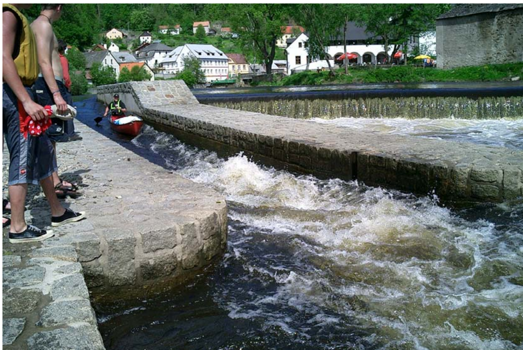
> Bootsgasse in Rožmberk