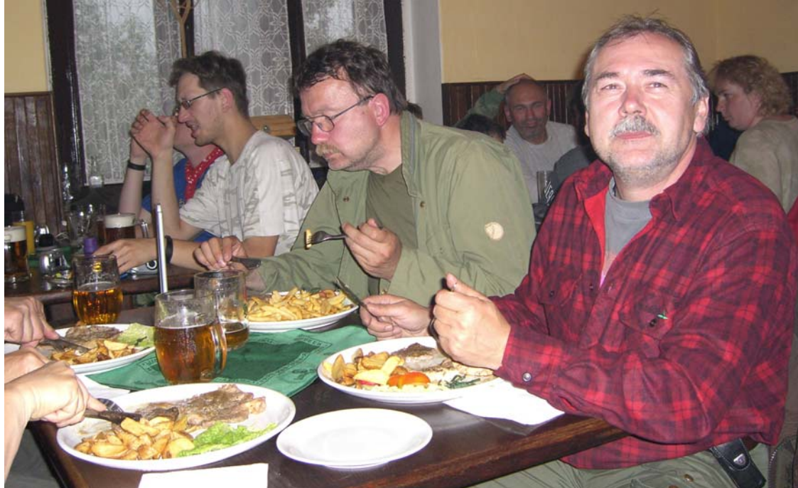
> Kulinarisches Vergnügen in der „Hospoda Soumarský Most“