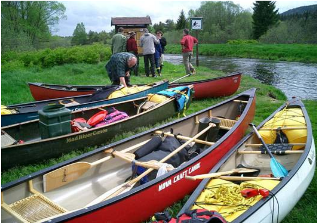
> Am Ende der ersten Tagestour

ausgebreitet haben. Schließlich kommt die kleine Brücke in Sicht. Den kleinen Schwall nehmen wir noch mit und landen direkt dahinter am linken Ufer an.