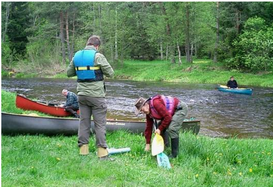
> Startvorbereitungen zur Tagestour durch den Nationalpark

Unter Vogelgezwitscher werden die Boote zu Wasser gelassen und sogleich durch die ersten, kleinen Stromschnellen manövriert. In der zügigen Strömung paddeln wir durch die einsame Waldkulisse mit seinen zauberhaft wirkenden Niederungsmooren, deren Krautbewuchs einen weiten Blick in die Landschaft freigibt. Stille umgibt uns. Schmal windet sich die Warme Moldau in engen Kurven ihrem Treffpunkt mit der Kalten Moldau entgegen – ein beliebter Rastplatz der Paddler und eine der wenigen Möglichkeiten im Gebiet der geschützten Moore an Land zu gehen. Auch wir nutzen diesen Ort der Vereinigung für eine ausgiebige Ruhepause, um verbrauchte Energien wieder aufzutanken.