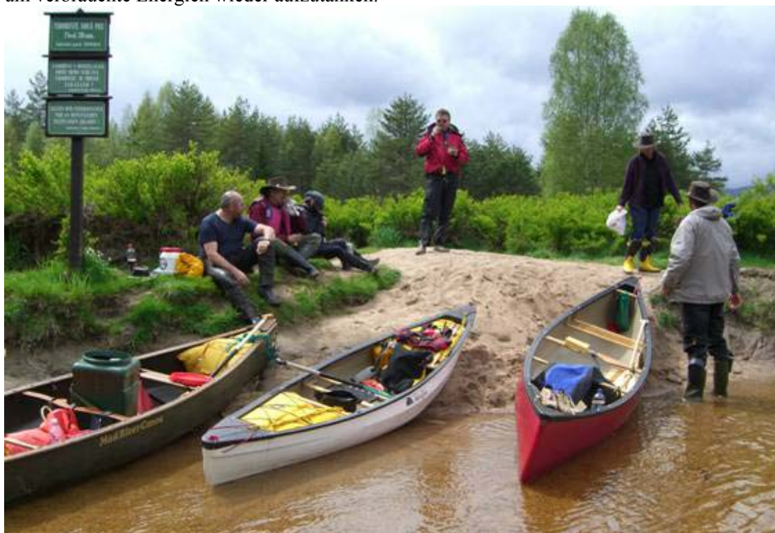
> Rastplatz am Zusammenfluß der Warmen und Kalten Moldau

Unter Vogelgezwitscher werden die Boote zu Wasser gelassen und sogleich durch die ersten, kleinen Stromschnellen manövriert. In der zügigen Strömung paddeln wir durch die einsame Waldkulisse mit seinen zauberhaft wirkenden Niederungsmooren, deren Krautbewuchs einen weiten Blick in die Landschaft freigibt. Stille umgibt uns. Schmal windet sich die Warme Moldau in engen Kurven ihrem Treffpunkt mit der Kalten Moldau entgegen – ein beliebter Rastplatz der Paddler und eine der wenigen Möglichkeiten im Gebiet der geschützten Moore an Land zu gehen. Auch wir nutzen diesen Ort der Vereinigung für eine ausgiebige Ruhepause, um verbrauchte Energien wieder aufzutanken.