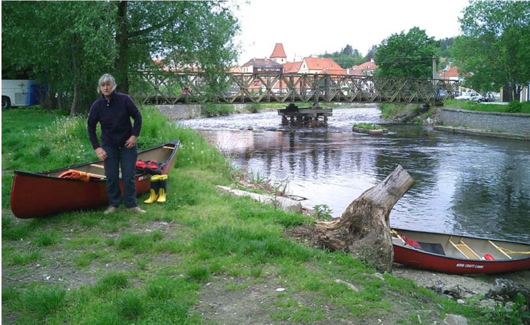
> Einsetzstelle in Český Krumlov

Bis Zlatá Koruna bremst kein künstliches Hindernis mehr den Flußlauf der Moldau, die sich in ihrem mal schmalen, mal breiten Flussbett allmählich entfalten kann und sich in weiten Kurven durch die einsame Waldgegend windet. Manche Welle reizt zum Surfen und einige leichte Kehrwasser am Ufer zum „Einparken“. Noch halten die zum größten Teil unter der Wasseroberfläche liegenden Steine große Distanz zueinander, so dass es keinerlei großartiger Manövriertechniken bedarf, um sie ohne Feindberührung hinter sich zu lassen.