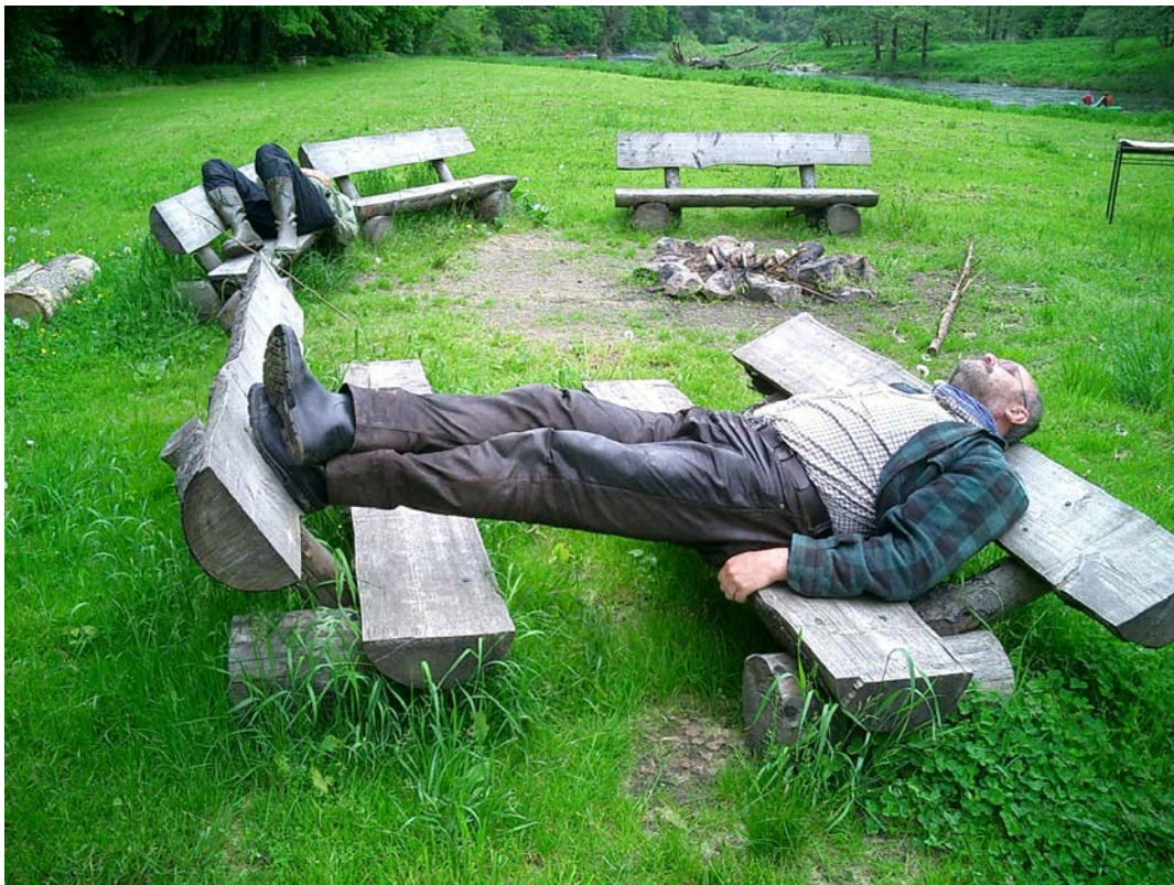
> Mittagsruhe an der Moldau

Bis Zlatá Koruna bremst kein künstliches Hindernis mehr den Flußlauf der Moldau, die sich in ihrem mal schmalen, mal breiten Flussbett allmählich entfalten kann und sich in weiten Kurven durch die einsame Waldgegend windet. Manche Welle reizt zum Surfen und einige leichte Kehrwasser am Ufer zum „Einparken“. Noch halten die zum größten Teil unter der Wasseroberfläche liegenden Steine große Distanz zueinander, so dass es keinerlei großartiger Manövriertechniken bedarf, um sie ohne Feindberührung hinter sich zu lassen.