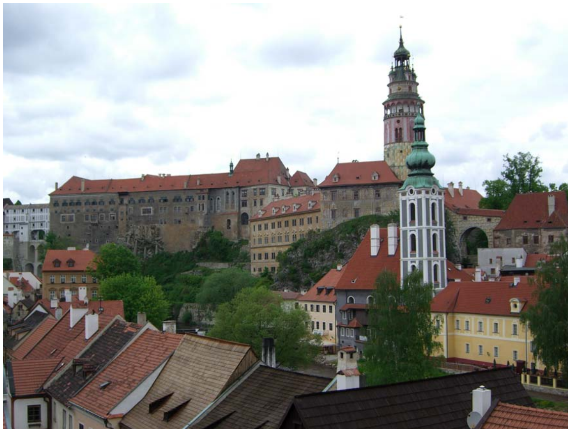
> Český Krumlov

Wieder geht es über die alte Holzbrücke auf die andere Seite der Moldau und auf direktem Weg, d. h. hügelab und hügelab, Richtung Altstadt.