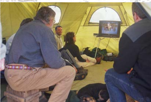
In der „Grotte“