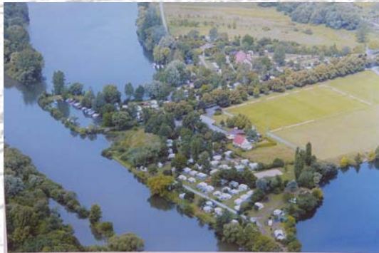
Der Campingplatz aus der Luft