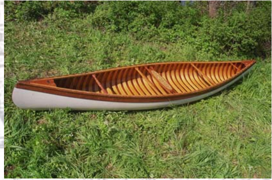
(M)Ein Traumboot: Der Nakoma